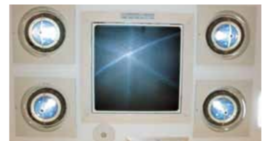
▲無菌化エアバリアシステムと自動追尾ルミネンスライト。