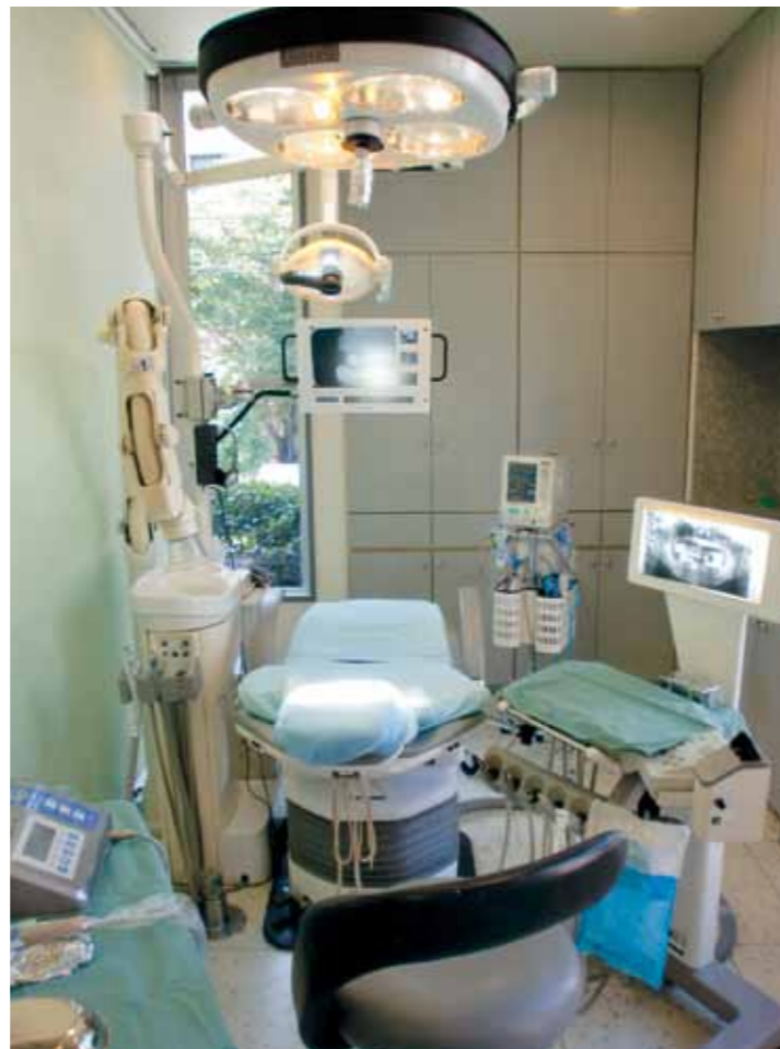
▲第一インプラントオペ室。二次オペ、少数歯症例専用。

診療科目 歯科、歯科口腔外科、矯正歯科、小児歯科 ●院長／米沢武師 ●医師数／常勤4名、非常勤4名 ●自由診療／インプラント ※CT診断、オペ費用、上下構造全て含む インプラント25万5000円～(インプラント1本20万円+ハイブリッドセラミッククラウン1歯5万5000円) ハーフディスマイルインプラント1本21万円