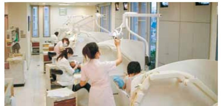
▲一般診療室。個々のユニットはすべてデジタル化し、視聴覚ライブラリーも完備。治療だけでなく、年2～3度の定期健診や歯の歯垢・歯石除去も推奨し、歯周病・虫歯予防を提言している。▶米沢院長のインプラントオペ風景。