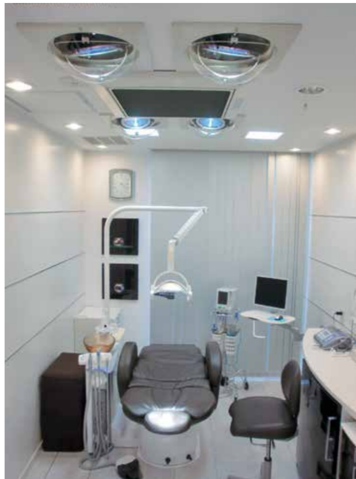
▲増設された第二インプラントオペ室。リラックス空間を求めつつ、清浄度クラス10000を実現した無菌科エアシステムや自動追尾ルミナンスライトを4灯設置。