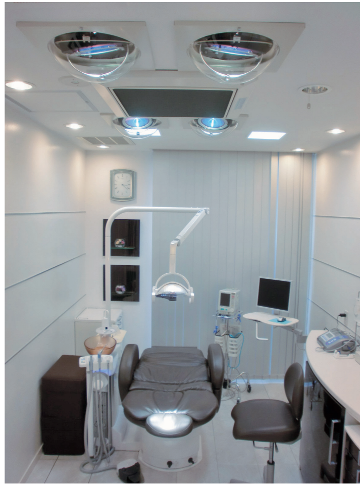
▲増設された第二インプラントオペ室。リラックス空間を求めつつ、清浄度クラス10000を実現した無菌化エアーステムや自動追尾ルミナンスライトを4灯設置。