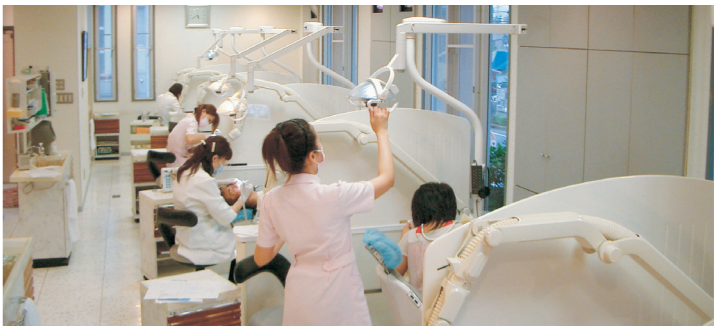
▲院内環境の整備も徹底しており、感染予防のためにAg+(銀イオン)発生装置や塩素イオン水を導入。抗菌性のある銀イオン水で、口内環境を清潔に保つことができる。