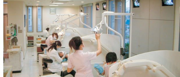
▲感染予防のためAg+（銀イオン）発生装置や酵素水を導入するなど、院内環境にも気を配っている。