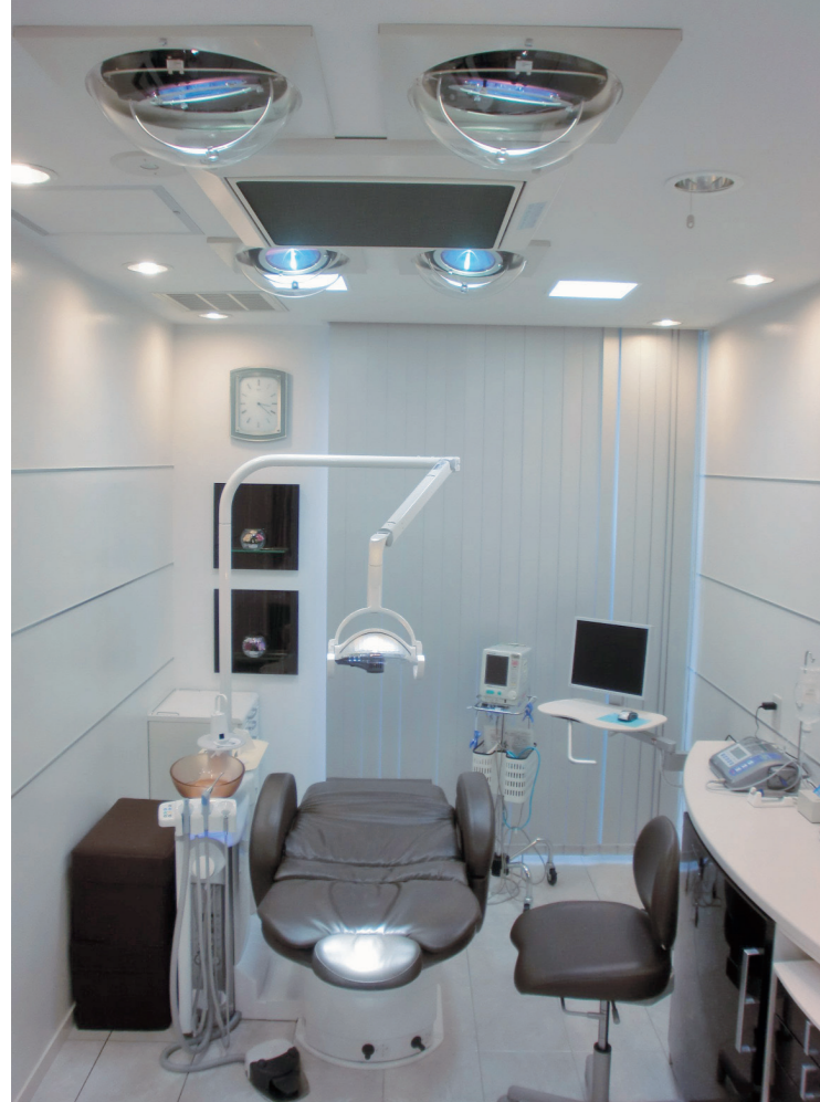
▲第二インプラントオペ室は、清浄度クラス10000を実現した無菌化エアーステムや自動追尾ルミナスライトを4灯設置。